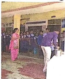
गांधीनगर, ता. 6 डॉक्टर तथा तेमनी टीम द्वारा कोमाना इजोनोने आरोग्य अंगे रोगवाणी हेलाय लो अने सभ्यो द्वारा कोभा गाममा तथा

त्राण दिवस माटे योजवामां आवेल उजवणीमां विद्यार्थीमां माटे स्पर्धां पण योजई