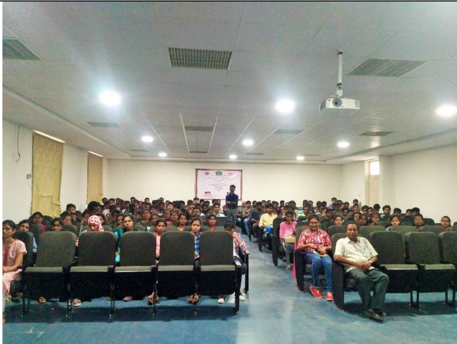
Participants during the Workshop